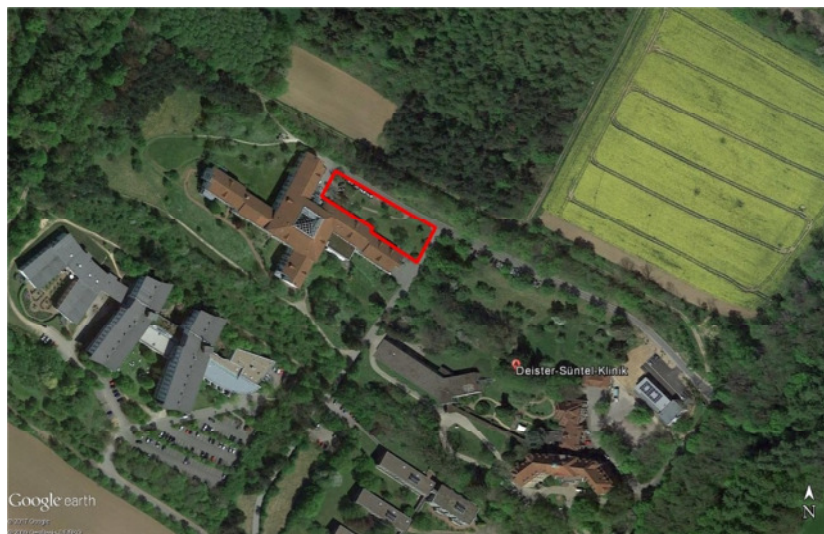
Abb. 1: Lage der Rehabilitationsklinik sowie der geplanten Parkplatzfläche